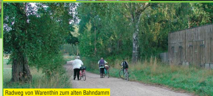
Radweg von Warenthin zum alten Bahndamm