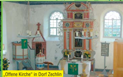
„Offene Kirche“ in Dorf Zechlin